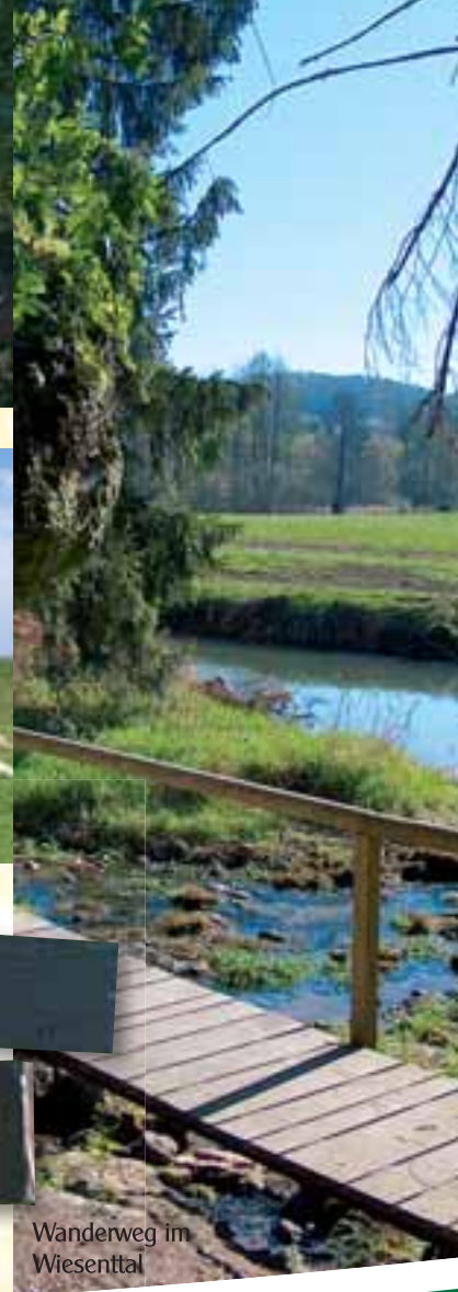
Wanderweg im Wiesental