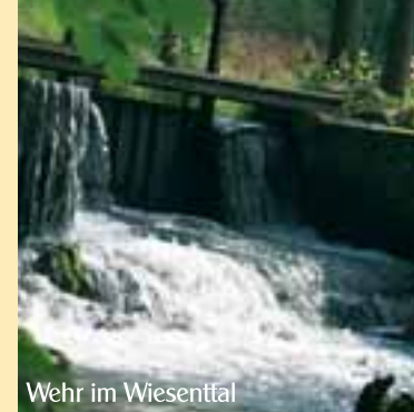
Wehr im Wiesental